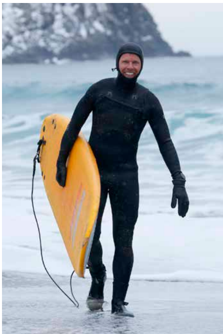
GLADA MINER PÅ stranden tack vare en 6 mm tjock våtdräkt med huva, och handskar och skor.