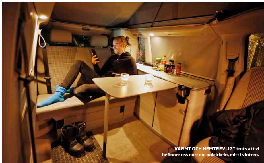
VARMT OCH HEMTREVLIKT trots att vi befinner oss norr om polcirkeln, mitt i vintern.