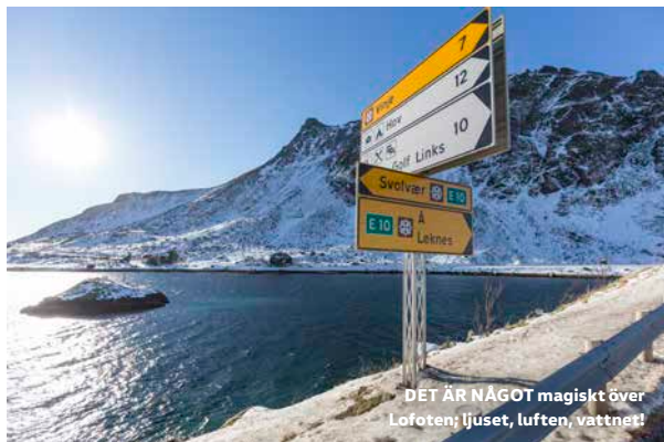
DET ÄR NÅGOT magiskt över Lofoten; ljuset, luften, vattnet!

Vågsurfa norr om polcirkeln – på vintern? Vi styrde nya Volkswagen California till en av världens nordligaste surfspots för ett arktiskt äventyr, och för att testa om det verkligen går att campa på vintern med en California.