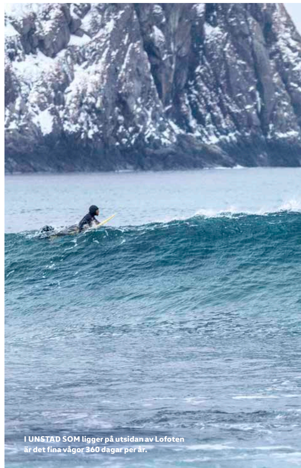
I UNSTAD SOM ligger på utsidan av Lofoten är det fina vågor 360 dagar per år.

”KÄNSLAN ÄR VÄL ATT LIKNA MED ATT FÅ ETT TON VATTEN ÖVER SIG OCH ATT SEDAN HAMNA I EN CENTRIFUG.”