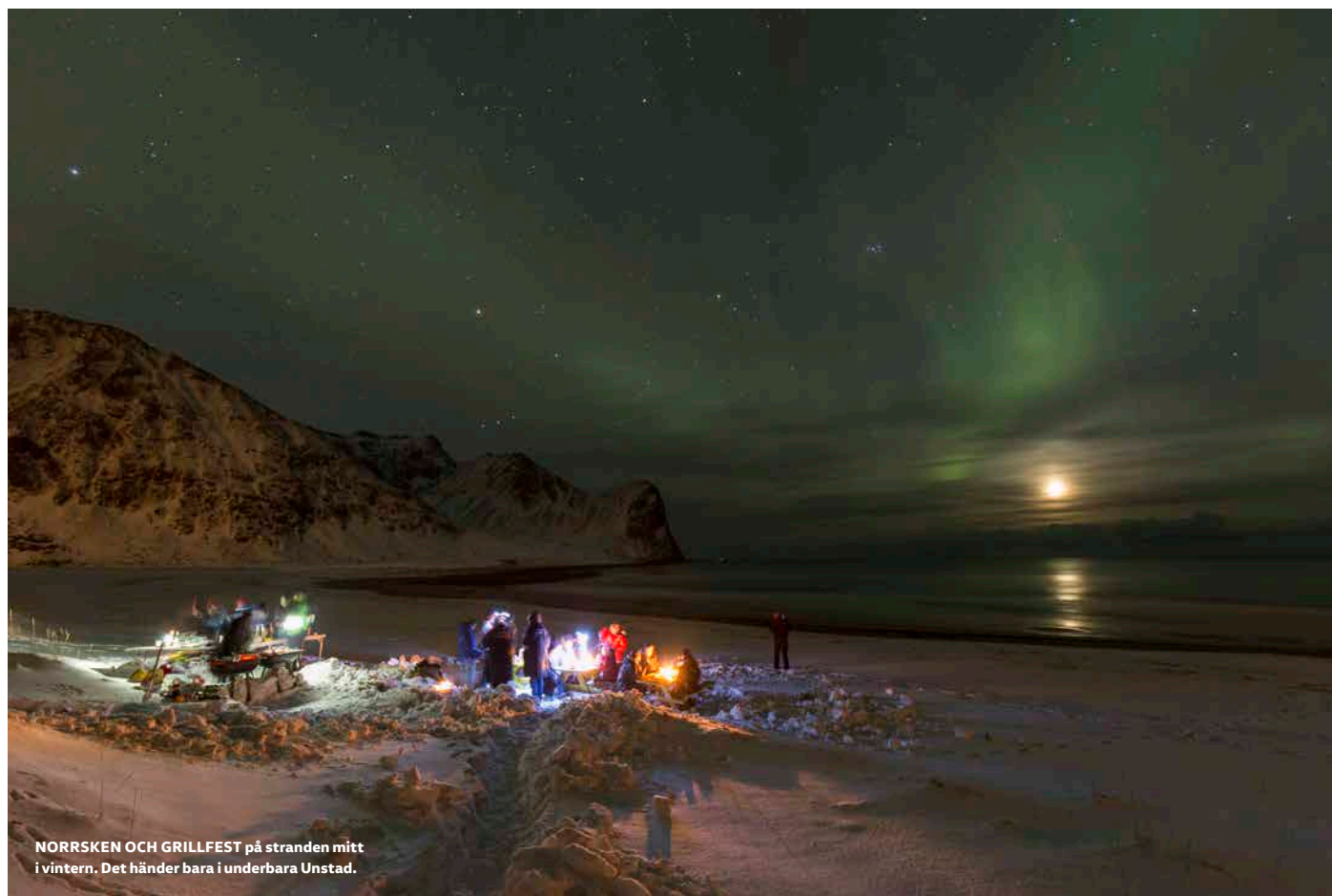
NORRSKEN OCH GRILLFEST på stranden mitt i vintern. Det händer bara i underbara Unstad.