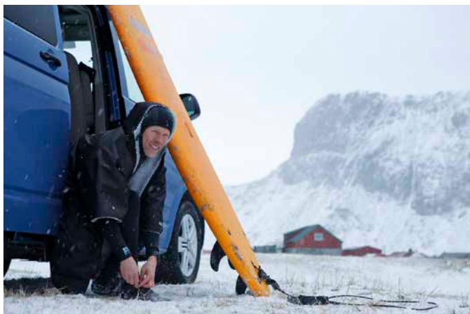
FRÅN VÄRMEN UT i kylan. Som tur är fick vi låna varma vintersurfrockar. Ett måste "after surf"!

vågorna bygger upp ordentligt under natten när vi släckt lampan i bilen.