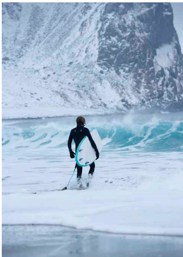
5 GRADER I VATTNET på vintern, och 7,5 på sommaren. Det mesta är annorlunda på Lofoten.

”DET ÄR VERKLIGEN NÅGOT MAGISKT MED NORRSKEN.”